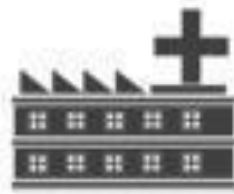
Hospitais, Clínicas e Laboratórios