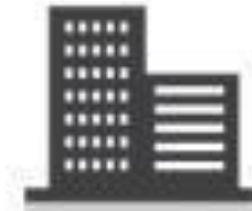
Sedes Corporativas, Edifícios Comerciais