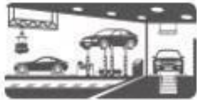
Rede de Concessionárias

Com foco em novas tecnologias e com serviços de alto desempenho o GRUPO ALMAX é especializado em soluções, integrando a inteligência operacional a uma plataforma de serviços ampla e diversificada.