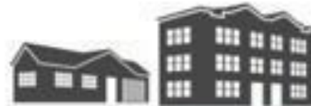
Condomínios Verticais e Horizontais